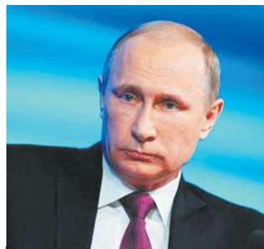
Владимир Путин, президент РФ: