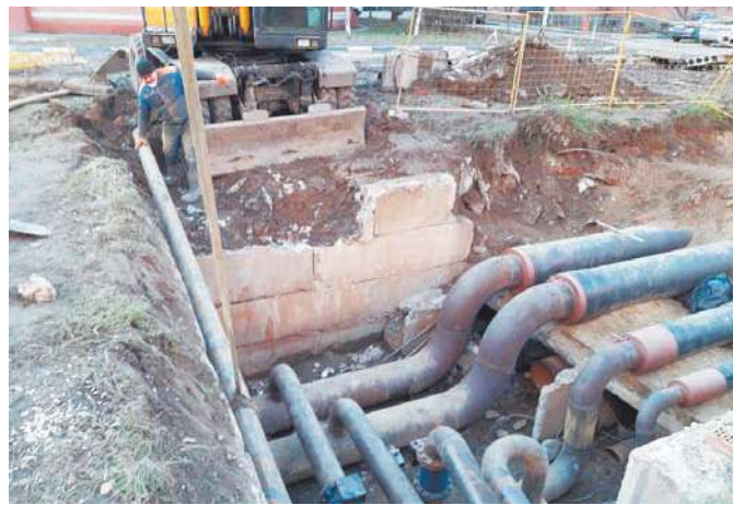
В Юбилейном меняют теплотрассу

Важно, что работы вели в режиме обеспечения минимального неудобства для жителей микрорайона. Четырёхтрубная теплосеть позволила проводить замену старых трубопроводов с использованием «обратки» при предельно кратко-